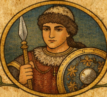
Mher le Jeune