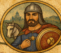
David de Sassoun